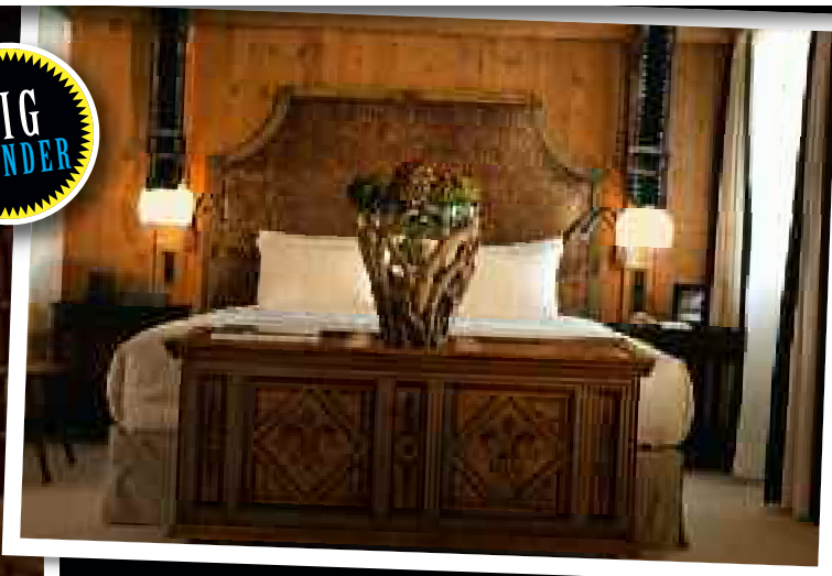
Ambiente cosy e luxoso são os trunfos do mais recente hotel de cinco estrelas de Gstaad.