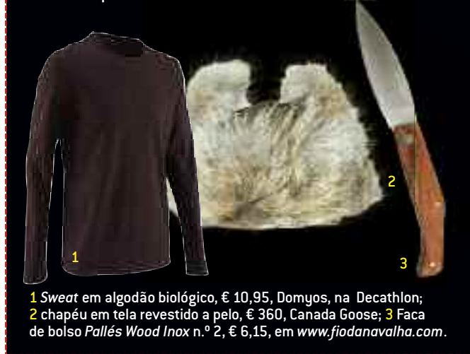
1 Sweat em algodão biológico, € 10,95, Domyos, na Decathlon; 2 chapéu em tela revestido a pelo, € 360, Canada Goose; 3 Faca de bolso Pallés Wood Inox n.º 2, € 6,15, em www.fiodanavalha.com .